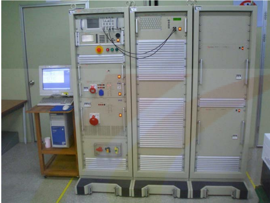
图三.系统最后实现图

图三为系统最后的实现的实物图，这个系统在一些大的空调厂家使用良好，虽然每次测量所花费的时间是三相全部采用标准电源产品的大约三倍，但是由于可以节约大笔资金，因此很受使用者欢迎。